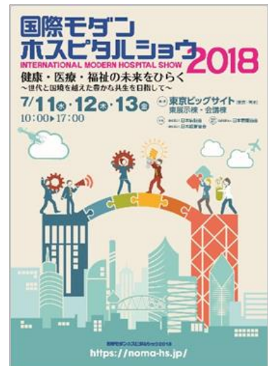
2018 ポスターイメージ