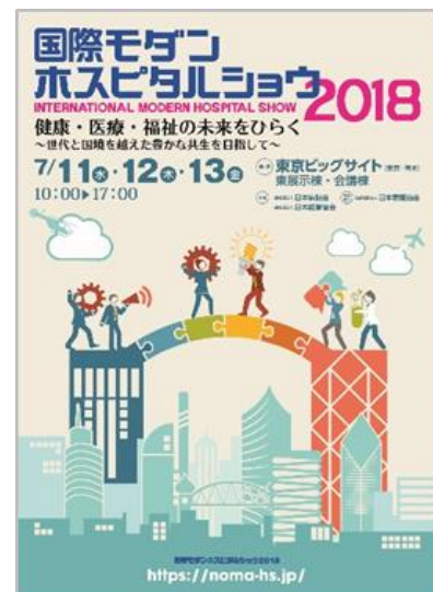
2018 ポスターイメージ

会期中はホスピタルショウカンファレンス(要事前登録)を連日開催します。学識経験者や専門家による、IoT、ICT、AIなどを活用した新たな病院のあり方についての講演や国内における新たな国際医療への展開をテーマとしたセッションなどを予定しています。今年日本看護協会の特別協力により、4部構成にて日本看護協会特別セミナー(無料)を開催します。ほかにも出展者セミナーをホール内2カ所と会議棟、東ホール主催者事務室で連日開催し、出展者による最新情報や事例の紹介が行われます。